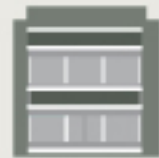
Ιδιωτική Εκπαίδευση - Κοινωνική Μέριμνα