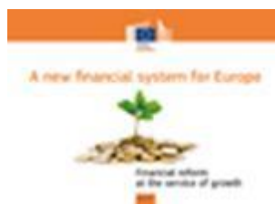
A new financial system for Europe – Financial reform at the service of growth