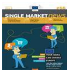
Single Market News N°66 (2013 – II)